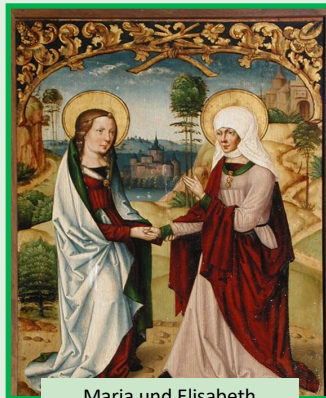
Maria und Elisabeth Flügelaltar in Dausenau

Das Datum des Johannistages ist sowohl symbolisch als auch zeitlich mit der