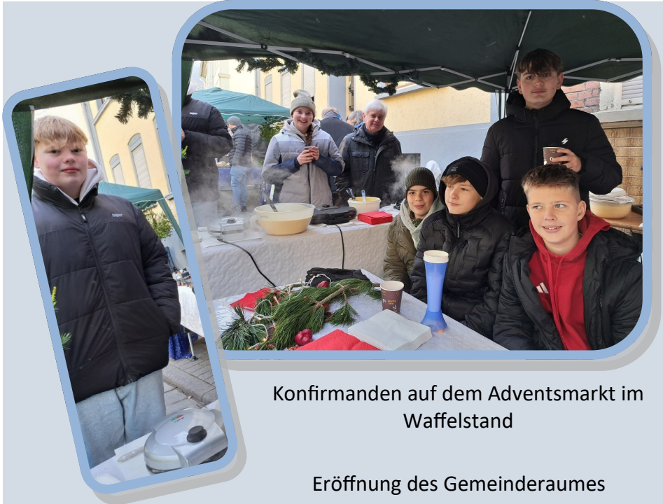
Konfirmanden auf dem Adventsmarkt im Waffelstand