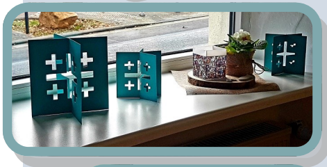
Eröffnung des Gemeinderaumes